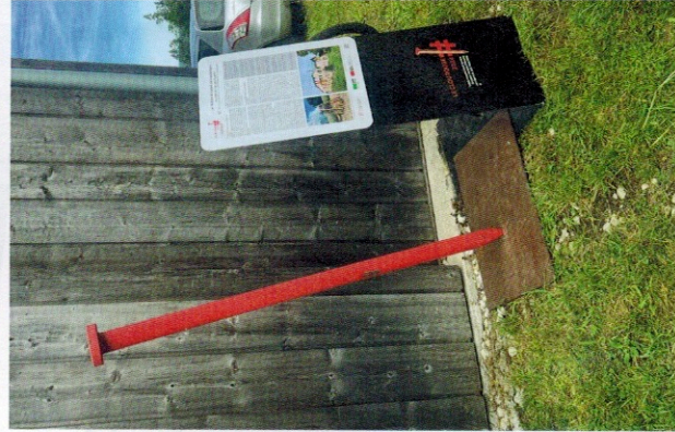
Le clou rouge